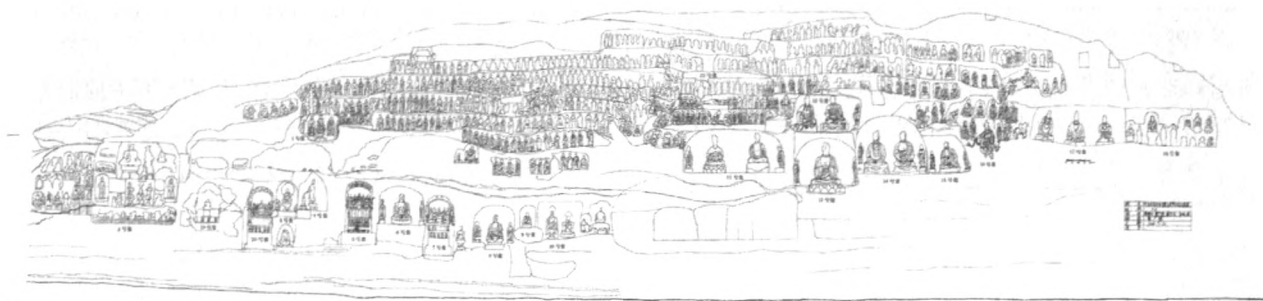
图2 莲花寺第1—21号龕立面图